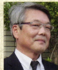
宇神 幸男 (作家・郷土史家)