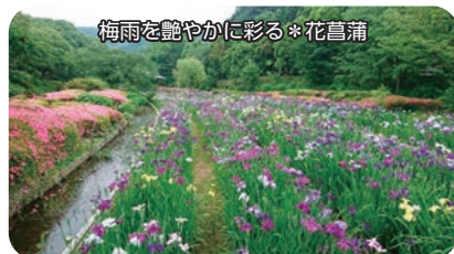
梅雨を艶やかに彩る*花菖蒲

6月某日に南楽園を訪問してきました。入口を歩くと、池に沿うように西菖蒲園が見え、紫色や黄色の花菖蒲が出迎えてくれます。里の家の前では鯉が泳いでいます。東菖蒲園からは、遠くの方に赤い橋が見えます。脇道には、紫陽花やサツキも咲いています。水辺を覗くと、アメンボやオタマジャクシに出会えそうです。一周して、ボート乗り場、撫でたら恵みをもらえる鯉のモニュメント、木漏れ日の小道、月待橋を歩きます。鳥が羽を広げて休んでいたり、水面にも静謐な風景が映し出されています。戻ってくる頃には、心がのびやかに優しくなっています。南楽園では四季折々の美しさを楽しむことができ、ゆったりとした時間が心をほぐしてくれます。