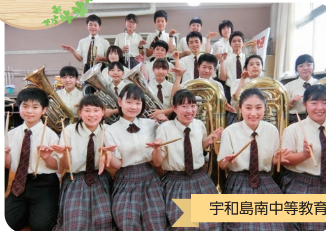
宇和島南中等教育学校 前期生吹奏楽部

日々感謝し、技術と友情と勉学に励む、まさに青春真っ只中の45名! 今年は演奏する機会が少なく残念です。でも、来年のコンクール目指して今から頑張るぞ! 早く皆さんに聴いてもらいたいなあ! よろしくお祈りします!