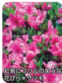
紅紫にフリルのような花びら*サツキ

6月某日に南楽園を訪問してきました。入口を歩くと、池に沿うように西菖蒲園が見え、紫色や黄色の花菖蒲が出迎えてくれます。里の家の前では鯉が泳いでいます。東菖蒲園からは、遠くの方に赤い橋が見えます。脇道には、紫陽花やサツキも咲いています。水辺を覗くと、アメンボやオタマジャクシに出会えそうです。一周して、ボート乗り場、撫でたら恵みをもらえる鯉のモニュメント、木漏れ日の小道、月待橋を歩きます。鳥が羽を広げて休んでいたり、水面にも静謐な風景が映し出されています。戻ってくる頃には、心がのびやかに優しくなっています。南楽園では四季折々の美しさを楽しむことができ、ゆったりとした時間が心をほぐしてくれます。